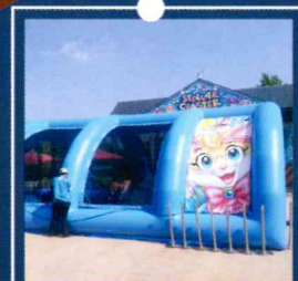
エア遊具の固定(アスファルトもOK)