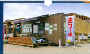
海の家、海上ウォーターパークなど砂場へ固定