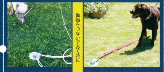
動物をつないでおく時に