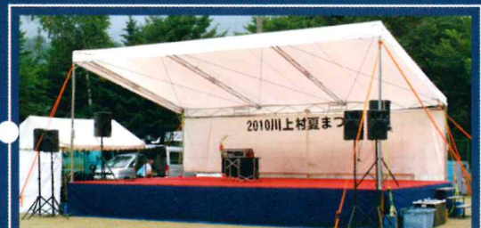
野外フェスに使用する大きいテントを固定