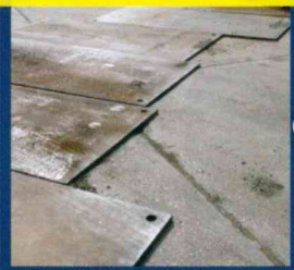
工事現場の入り口のメタルプレートの固定