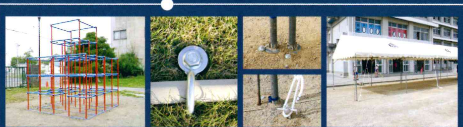
遊具、サッカーゴール、テントを固定